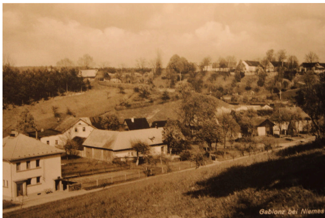
Jabloneček v roce 1936

Od našeho tábořiště je nejbližší zmíněná zaniklá obec Kostřice, kde jsou v současné době seníky a ruiny starých domů včetně tzv. Wood'áku, nebo Proseč, kde jsou v současné době rybízová pole a památné lípy a kde nalezneme vedle cesty staré sklepy ve skále. Z mnoha dnes zaniklých vesnic zůstávají ruiny zbořených domů nebo zbytky hřbitovů, studen, sklepů či kostelů.