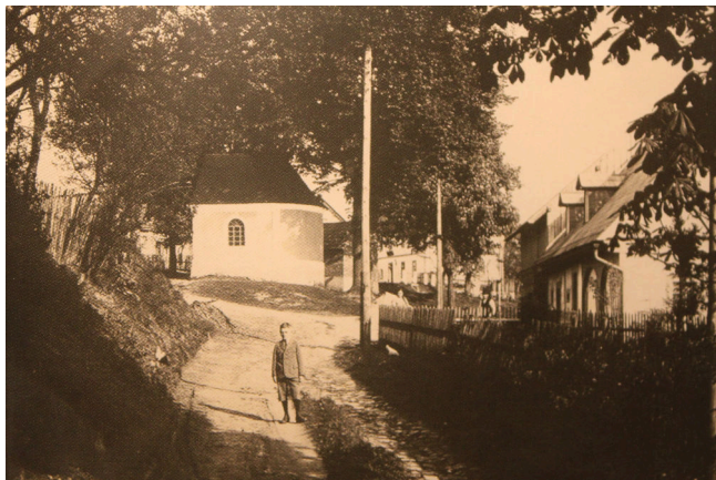
Proseč v roce 1934

Následkem poválečného odsunu německých obyvatel v roce 1945 zůstalo mnoho obydlí prázdných, protože se do nich nastěhovalo jen málo Čechů. Po vzniku VVP, kdy bylo odsunuto veškeré zbylé obyvatelstvo, se vesnice (až na výjimky, o kterých jsem psal — Hradčany, Náhlov, Kuřivody nebo Ploužnice) staly zcela opuštěnými.