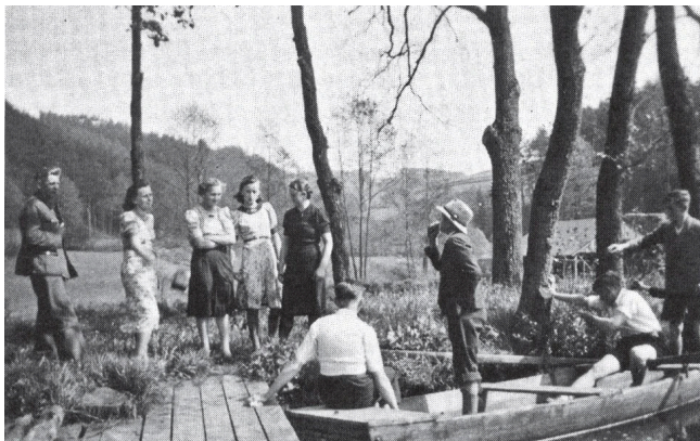
Rybník Zourovského mlýna v roce 1935

Před válkou v přibližně dvaceti obcích, které po roce 1947 spadaly pod oblast VVP Ralsko, žilo necelých sedm tisíc obyvatel. Během fungování VVP (tedy celkově během zhruba 40 let) došlo kromě zániku necelých 20 vesnic také k zániku mnoha samot (např. Krupského dvora) nebo mlýnů (např. Zourovského — u Frant'áku).