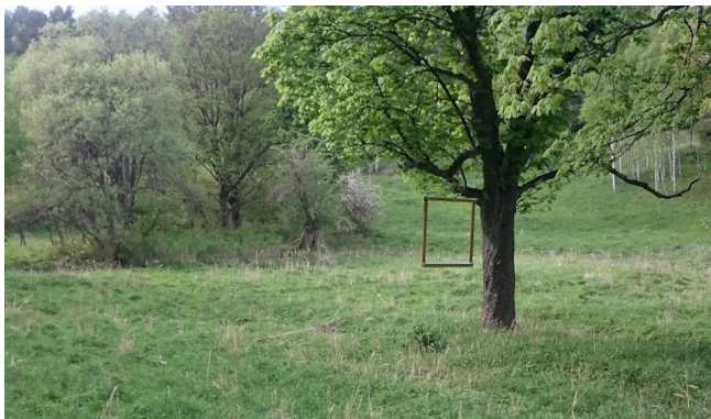
Současná připomínka obce Okna