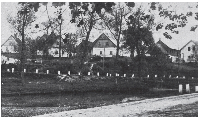
Bývalá obec Okna