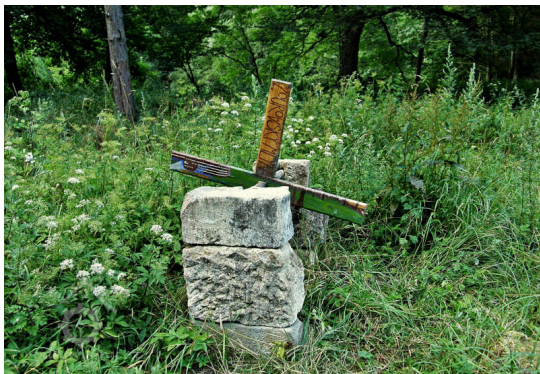
Památník Zourovského mlýna